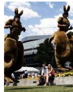
dpa-Bild des Tages